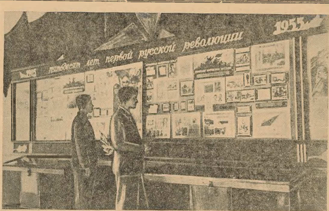
Грамадскасць ўніверсітэта разам з усёй краінай шырока адзначае пяцідзясяцігоддзе першай рускай рэвалюцыі. Гэтай слаўнай гадавіне будучы прысвечаны навуковыя сесія выкладчыкаў, тэматычныя вечары на факультэтах і многія іншыя мерапрыемствы, падрыхтоўка да якіх пачалася з першых дзён навучальнага года.

Новыя студэнты ў гэтыя дні знаёмяцца з ўніверсітэтам, дзе ім давядзецца правесці некалькі год. Зыходзячы яны і ў фундаментальную бібліятэку ўніверсітэта. Гэта сапраўды скарбніца Тарту. У ёй налічваецца да мільёна васьмісот тысяч кніг тамоў. Сярод іх многа ўнікальных выданняў.